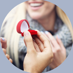
Liebe und Ehe