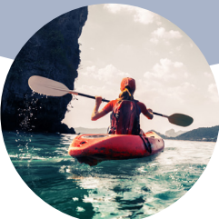
Freiheit und Verantwortung